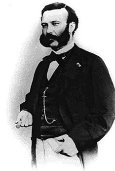
Henry Dunant

Als größte Hilfsorganisation ist das Rote Kreuz bei sozialer Benachteiligung, Krankheit oder Katastrophen für Sie da. Ein Zeichen, das dafür steht, Menschen in Not zu helfen und das auf der ganzen Welt, aber auch in unserem Kreisverbandsgebiet. Das Martinshorn der Rettungswagen ruft es uns fast täglich ins Gedächtnis. Die Geschichte des Deutschen Roten Kreuzes ist mehr als 150 Jahre alt. So wurde 1863 in Baden-Württemberg die erste Rotkreuzgesellschaft der Welt gegründet. Die Idee, Menschen allein nach dem Maß der Not zu helfen, ohne auf Hautfarbe, Religion oder Nationalität zu achten, geht auf den Schweizer Henry Dunant zurück.