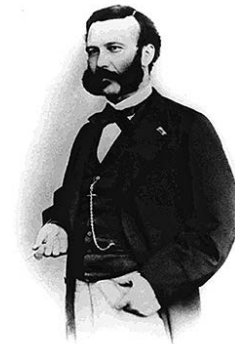
Henry Dunant

Als größte Hilfsorganisation ist das Rote Kreuz bei sozialer Benachteiligung, Krankheit oder Katastrophen für Sie da. Ein Zeichen, das dafür steht, Menschen in Not zu helfen und das auf der ganzen Welt, aber auch in unserem Kreisverbandsgebiet. Das Martinshorn der Rettungswagen ruft es uns fast täglich ins Gedächtnis. Die Geschichte des Deutschen Roten Kreuzes ist mehr als 150 Jahre alt. So wurde 1863 in Baden-Württemberg die erste Rotkreuzgesellschaft der Welt gegründet. Die Idee, Menschen allein nach dem Maß der Not zu helfen, ohne auf Hautfarbe, Religion oder Nationalität zu achten, geht auf den Schweizer Henry Dunant zurück.