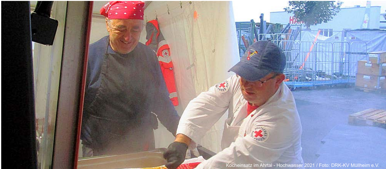
Kocheinsatz im Ahrtal - Hochwasser 2021