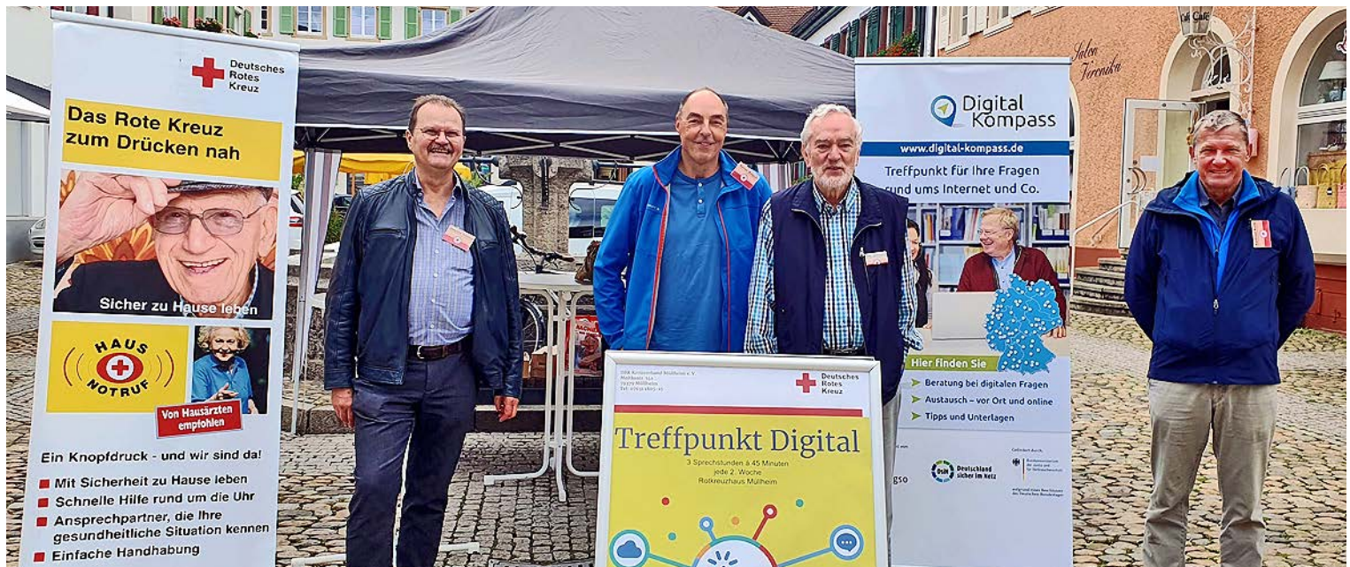
Marktplatz-Aktion „Werbung Treffpunkt Digital“ wHerbst 2022